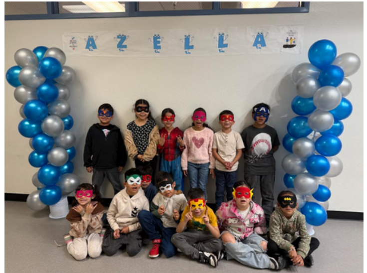
¡Nuestros superhéroes AZELLA!

Fortalecer las asociaciones y la comunicación entre el personal, los estudiantes, las familias y los miembros de la comunidad.